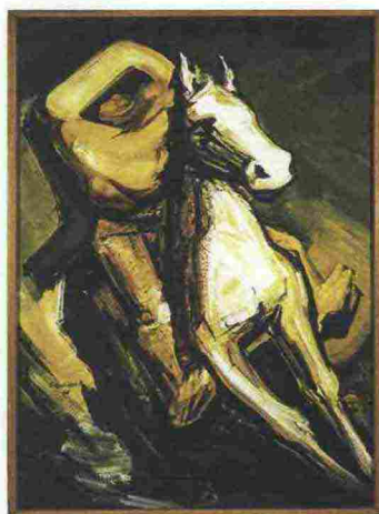
A sinistra, studio per il murale Zapata di David A. Siqueiros (1966). A destra, Pico e Inesita (1928) di Diego Rivera.