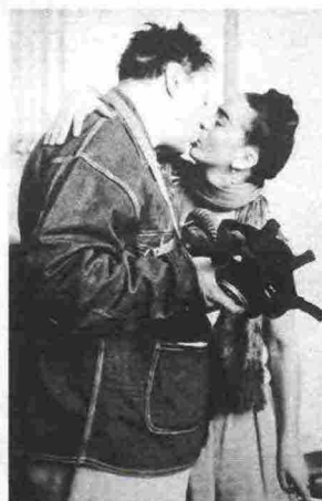
Frida Kahlo e Diego Rivera in uno scatto del 1928 di Nickolas Muray.

È passata alla storia come la “exposición pendiente” (la “mostra sospesa”): l’inaugurazione era prevista il 13 settembre 1973 a Santiago del Cile, ma il colpo di Stato del generale Augusto Pinochet la bloccò. Un atto dovuto ricreare il progetto originale che approda al Palazzo Ducale di Genova fino al 9 settembre. México. La pittura dei grandi muralisti e gli scatti di vita di Diego Rivera e Frida Kahlo raccoglie 70 opere firmate da tre maestri del muralismo messicano: Diego Rivera appunto, José Clemente Orozco e David Alfaro Siqueiros. Dei “los tres grandes”, come venivano chiamati, sono esposti bozzetti (di Siqueiros, per esempio, Zapata , studio per il murale del castello di Chapultepec, 1966) e tele ( Pico e Inesita , 1928, di Rivera). Non solo: in mostra anche una cinquantina di scatti, protagonista Rivera con la moglie, l’icona assoluta Frida Kahlo. Guarda quello realizzato da Nickolas Muray nel 1928: fu vero amore, anche se contrastato. T