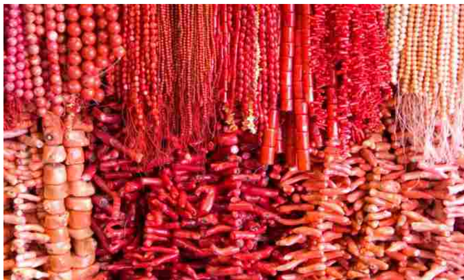
Gioielli in corallo

Dall'oro al corallo, ecco gli indirizzi in cui regalarsi (o ammirare) preziosi manufatti