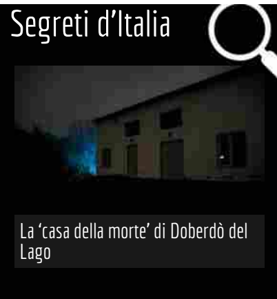
La 'casa della morte' di Doberdò del Lago