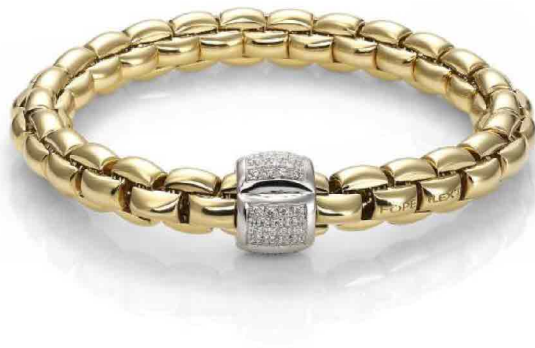
Fope. Flex'it Eka, bracciale elastico, oro 18kt, oro bianco, pavè di diamanti (2017)