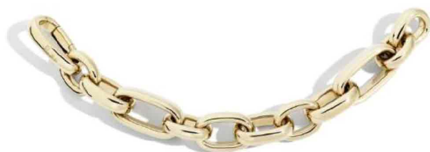
Pomellato. Iconica, bracciale in oro rosa (2017)

Un elegante volume di Alba Cappellieri sulla storia e sulla simbologia della catena a cui è dedicata l'esposizione "Intrecci Preziosi" al Museo del Gioiello di Vicenza