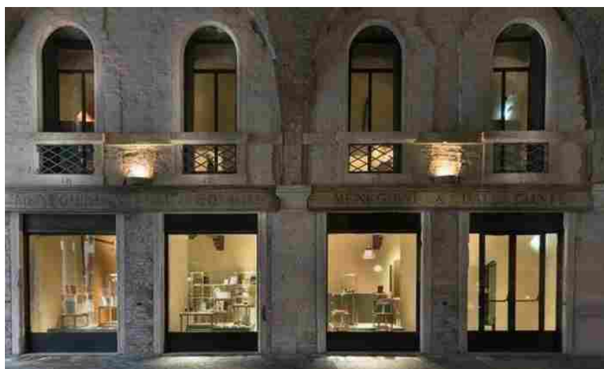
Fachada. Prédio histórico que abriga o Museo del Gioiello - Prefeitura de Vicenza / Cosmo Laera

VICENZA. “Você vai começar a pensar sobre o que as joias