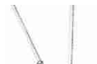
Vicenza Miss Sixty Jewels