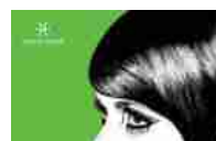
Vicenza Charm 2009