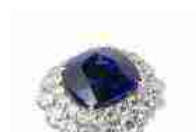
Vicenza Choice 2009