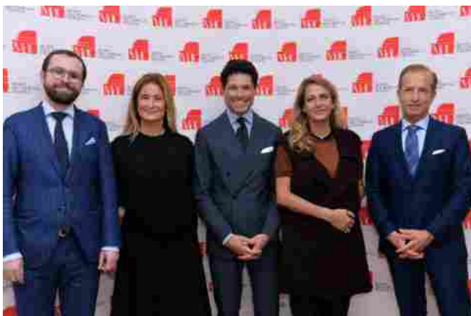
Museo del Gioiello