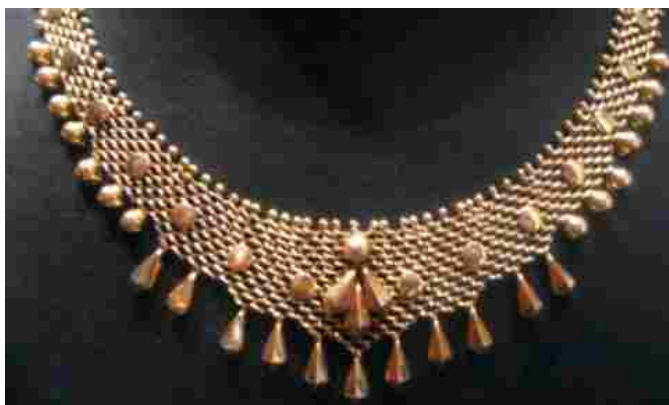
Museo del Gioiello

LA LOCATION - Primo in Italia ma anche in Europa e tra i pochi nel mondo, il Museo del Gioiello è stato realizzato innanzitutto in una location splendida. Articolato su due livelli, il museo ha al piano terreno l'ingresso, con il bookshop, punto di riferimento culturale che raccoglie testi nazionali ed internazionali sul gioiello. A seguire la sala versatile delle esposizioni temporanee, in cui sono previste mostre dedicate ai preziosi della gioielleria. Il piano superiore, invece è il cuore del Museo e presenta nove sale, ricavate nel cuore della Basilica, cinquecentesco simbolo della città veneta, il Museo riunisce circa 400 pezzi, selezionati in prestigiose collezioni pubbliche e private, per illustrare la storia dei gioielli nel tempo e nelle culture.