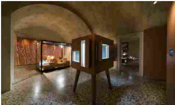
Museo del Gioiello

IL PRESIDENTE - «E' certamente un progetto straordinario» dichiara Matteo Marzotto presidente di Fiera Vicenza « che premia e valorizza l'identità culturale di questa regione e il distretto orafa-gioielliero. Fiera di Vicenza rafforza così la propria capacità di creare valore e nel proporsi come innovativo esempio di cross-fertilization tra business,cultura e fashion».