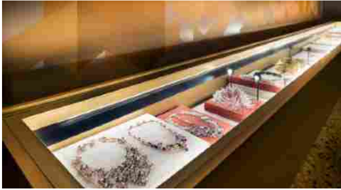
Museo del Gioiello

IL PRESIDENTE - «E' certamente un progetto straordinario» dichiara Matteo Marzotto presidente di Fiera Vicenza « che premia e valorizza l'identità culturale di questa regione e il distretto orafa-gioielliero. Fiera di Vicenza rafforza così la propria capacità di creare valore e nel proporsi come innovativo esempio di cross-fertilization tra business,cultura e fashion».