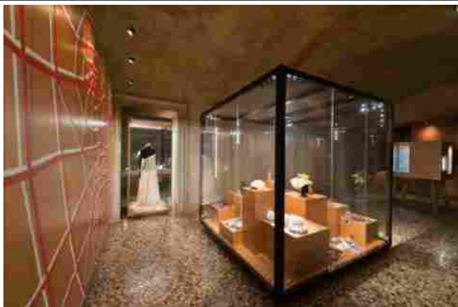
Museo del Gioiello

LA LOCATION - Primo in Italia ma anche in Europa e tra i pochi nel mondo, il Museo del Gioiello è stato realizzato innanzitutto in una location splendida. Articolato su due livelli, il museo ha al piano terreno l'ingresso, con il bookshop, punto di riferimento culturale che raccoglie testi nazionali ed internazionali sul gioiello. A seguire la sala versatile delle esposizioni temporanee, in cui sono previste mostre dedicate ai preziosi della gioielleria. Il piano superiore, invece è il cuore del Museo e presenta nove sale, ricavate nel cuore della Basilica, cinquecentesco simbolo della città veneta, il Museo riunisce circa 400 pezzi, selezionati in prestigiose collezioni pubbliche e private, per illustrare la storia dei gioielli nel tempo e nelle culture.