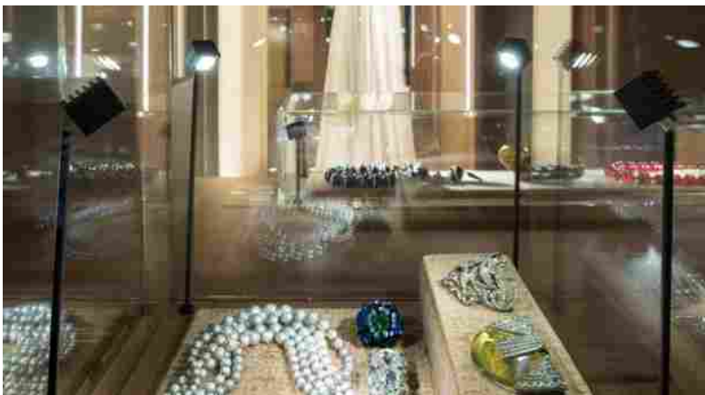
Museo del Gioiello

Tutto su: Moda Accessori moda Italia Marzotto Matteo